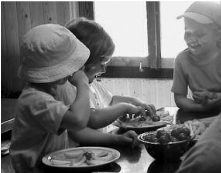
Gemüse für Kinder schmackhaft zubereitet: Geniessertag in Illnau-Effretikon

Die von Arbeitsgruppen realisierten Projekte konnten besonders Personen erreichen, die sich im Alltag bereits gesundheitsbewusst verhalten. Das Bezirksprojekt hat also vor allem Leute mit gesundem Verhalten bestärkt, andere wurden