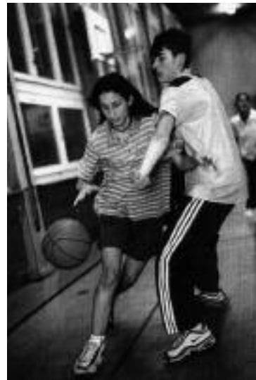
Mitternacht: girl meets boy, einmal anders

Der Förderverein Midnight Projekte arbeitet daran, sein grosses Fachwissen bei der Organisation von offenen Sportangeboten auch für Kinder einzusetzen und will die Turnhallen neu am Sonntagnachmittag öffnen. Geplant ist im Winter 2006/07 «Open Sunday» in zwei bis drei Turnhallen im Kanton Zürich anzubieten. Mädchen und Jungen verfügen durch «Open Sunday» in ihrer unmittelbaren Nach-