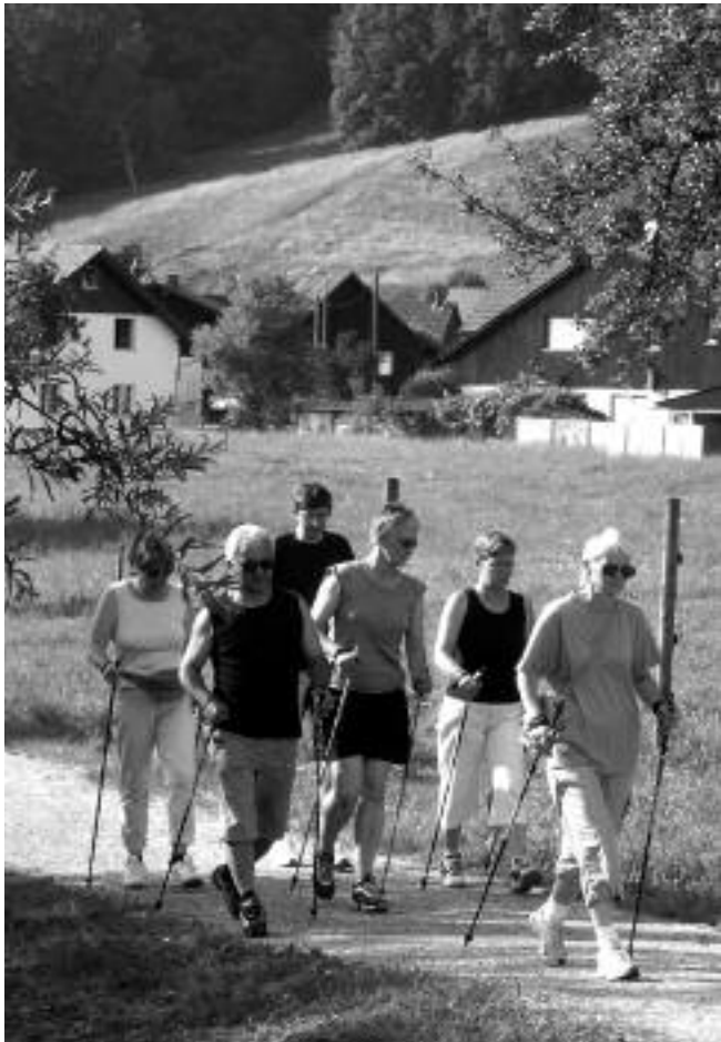
Nordic Walking in Wila

Entspannung (BEE)» lanciert. In Zusammenarbeit mit den Gemeinden und engagierten Akteuren wurden in drei Pilotbezirken (Dielsdorf, Horgen, Pfäffikon) lokale Angebote und Projekte in diesen Bereichen geplant und umgesetzt. Das P&G hat regelmässig darüber berichtet und der Artikel auf der nächsten Seite präsentiert einige Evaluationsergebnisse.